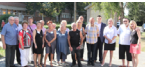
Inauguration, septembre 2016

Revenons, à travers quelques dates sur les événements marquants de l'association :