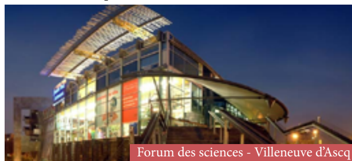
Forum des sciences - Villeneuve d'Ascq

La visite de la ferme de Quarouble : les élèves partiront à la découverte des animaux de la ferme... Les enfants qui ont plutôt l'habitude de les voir en images les découvriront dans leur milieu de vie. Ils devront les reconnaître et les nommer. Ils prendront conscience de leur taille, de leur manière de se déplacer, de leur alimentation.