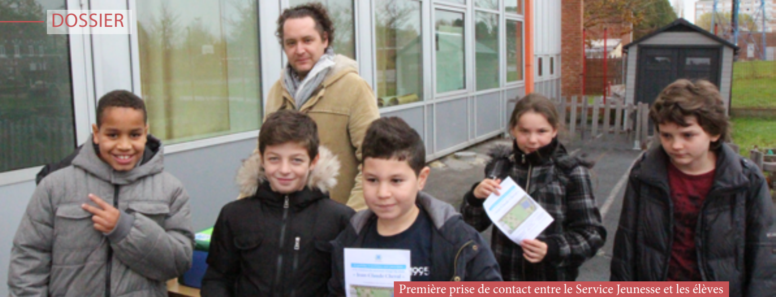
Première prise de contact entre le Service Jeunesse et les élèves