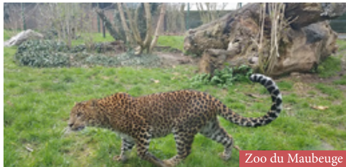
Zoo du Maubeuge

Une sortie éducative : au Zoo de Maubeuge et au Forum Antique de Bavay, un travail de préparation sera effectué en classe en amont de celle-ci sur l'Antiquité, les chaînes alimentaires et les cycles de vie.