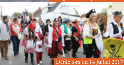
Défilé lors du 14 Juillet 2017