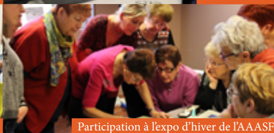
Participation à l'expo d'hiver de l'AAASF