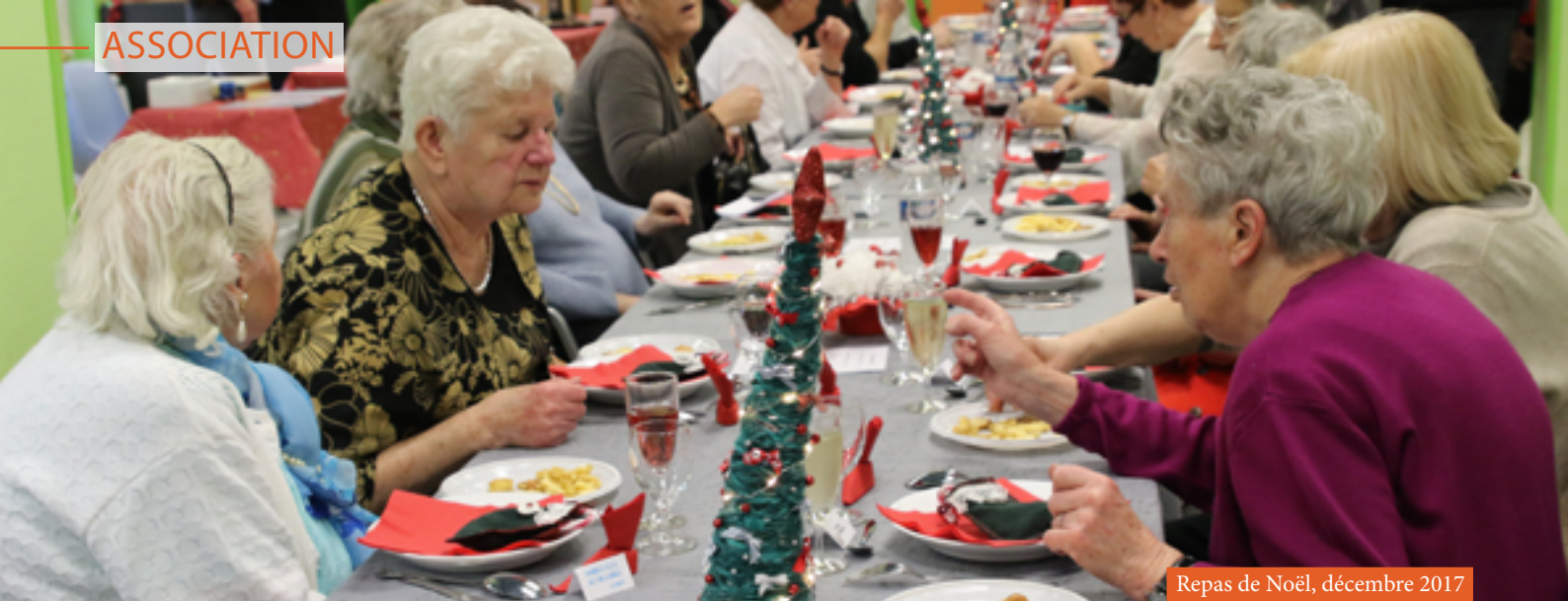
Repas de Noël, décembre 2017