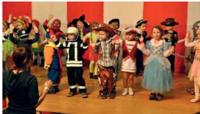
Kindergartenkinder aus Morschenich