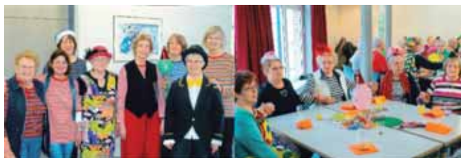
Das Team des „Frühstückstreffs“ Die bunt kostümierten Gäste beim Schunkeln

Zwischen den einzelnen Aufführungen wurden mit viel Schwung karnevalistische Lieder mit allen zusammen gesungen. Weil es so schön war blieb man noch gut gelaunt ein wenig länger als sonst beim Frühstückstreff beisammen. Es war eine rundum gelungene Veranstaltung!