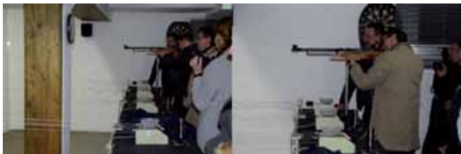
Beide Bürgermeister testeten mit einem Probeschuss ihr Schießkönnen.

Quievrechain, die neue Städtepartnerschaft unserer Gemeinde