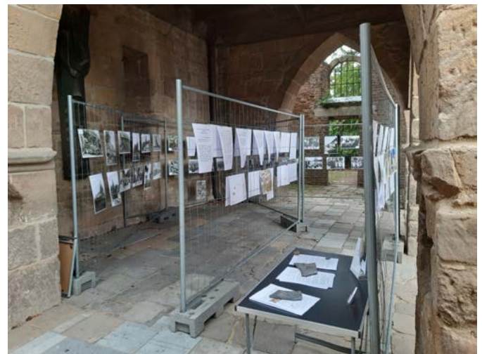
Die Bilderausstellung beim Ortsfest lockte mehrere hundert Besucher, die über die alten Aufnahmen des Lindenplatzes und der Alten Kirche Merzenich staunten.

Die Arbeit im Gemeindearchiv geht weiter. So dürfen wir uns im neuen Jahr wieder auf interessante und vielfältige Veranstaltungen freuen. Seien Sie wieder mit dabei und erleben Sie die Geschichte der Gemeinde Merzenich.