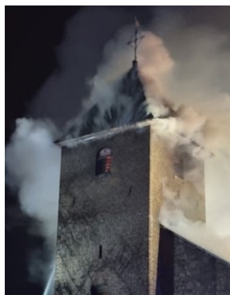
Der Kirchturm stand in Flammen. Konnte jedoch nur schwerlich gelöscht werden.

Der 17. April 2023 und die Bilder, die durch die Presse gingen, werden vielen Menschen lange in Erinnerung bleiben. Ein Symbol Morschenichs stand in Flammen. Ein Schicksal, das sie nicht das erste Mal traf. Die St. Lambertus Kirche erlebte eine wechselhafte Geschichte, die häufig von Zerstörung und Wiederaufbau geprägt war. Gesichert ist unter anderem ein Brand der Kirche am 26. April 1814. Ebenso wurde sie im 2. Weltkrieg zu 90% zerstört. Nie war sie danach wieder dieselbe, der Kirchenbau der jeweiligen Zeit war in seiner Gesamtheit verloren. Aber die Kirche wurde wiederaufgebaut, sodass sie auch für spätere Generationen ein Mittelpunkt des Lebens werden konnte.