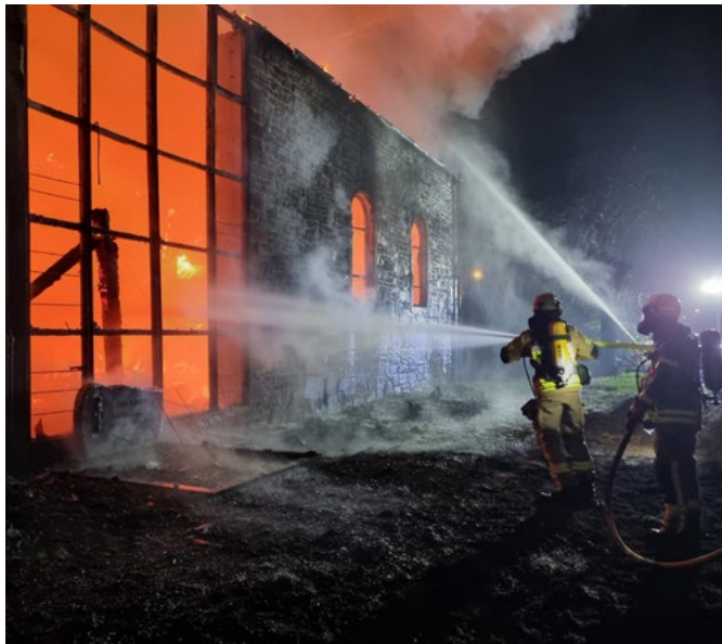
Der Kirchenbau stand im Vollbrand und war nicht mehr zu retten.

„Das Bild war grausig“, schildert der Leiter der Freiwilligen Feuerwehr seinen ersten Eindruck, als er die brennende Kirche in Morschenich (Alt) sah. „Das Dach war an einigen Stellen schon durchgebrannt [und] das Kirchenschiff war in Mitleidenschaft gezogen. Man sah, dass das Feuer sich von der Sakristei über das Kirchenschiff bis in den Glockenturm gefressen hatte.“ Das Gebäude war in Vollbrand.