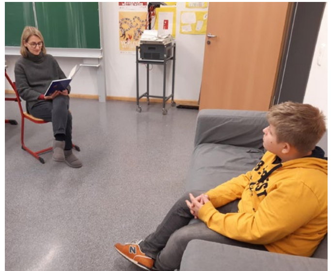
Mehr Aufmerksamkeit geht nicht.