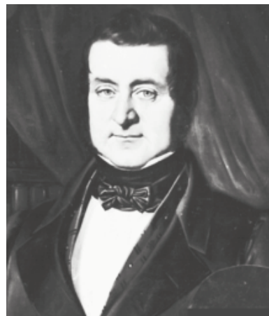
Hermann Joseph Stupp

An den Befreiungskriegen 1813 bis 1815 nahm Stupp auf Seite der Preußen teil. Im Jahr 1848 war er Kommandant der Kölner Bürgerwehr. Im Mai 1848 wurde er zum Deputierten des Wahlkreises Düren in die preußische Nationalversammlung gewählt. Nach seinem Studium der Jurisprudenz war er als Rentmeister und Advokat-Anwalt beim Rheinischen Appellationsgerichtshof tätig. Er wurde später zum Justizrat und geheimen Regierungsrat ernannt. Von 1846 bis 1849 sowie 1850 war Stupp stellvertretender Gemeindeverordneter zu Köln. 1849 sowie 1850 bis 1851 war er Gemeindeverordneter von Köln. Er zählte zu den konstitutionell-liberalen Politikern. 1855 bis 1863 war Stupp dann Mitglied des preußischen Herrenhauses, 1855 bis 1863 Mitglied des Provinziallandtags, 1851 Vizemarschall des rheinischen Provinziallandtags und 1851 bis 1863 Oberbürgermeister zu Köln.