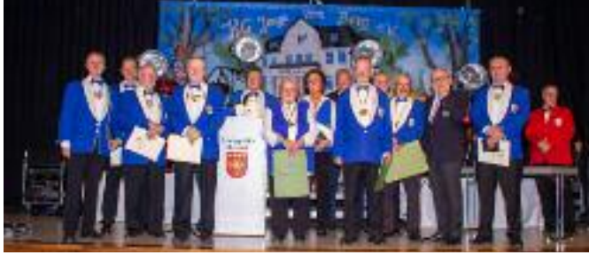
Geehrte Mitglieder der KG Jonge vom Berg Merzenich

Leider waren einige verdiente MitgliederInnen verhindert, so dass wir die vorgesehenen Ehrungen an anderer Stelle in einem würdigen Rahmen nachholen werden.