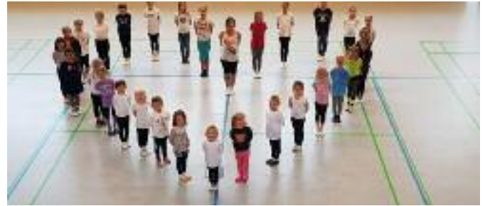
Ein Großteil der KG-Kinder beim Trainingswochenende

und Betreuerinnen sowie Helfer im Hintergrund, die den KG Kids dieses schöne Erlebnis ermöglicht haben.