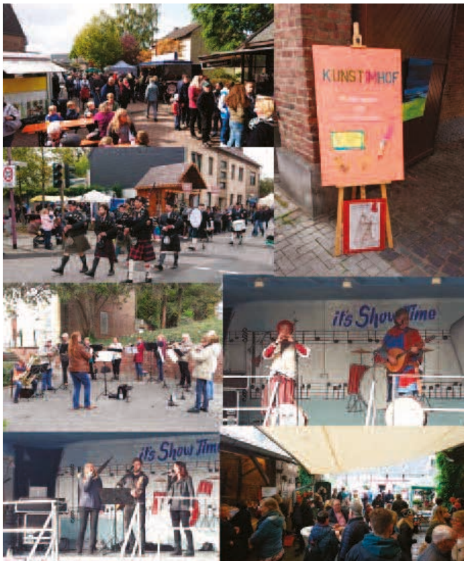
Eindrücke vom Merzenicher Ortsfest 2018.

Bei strahlendem Sonnenschein folgten zahlreiche Besucherinnen und Besucher der Einladung der Gemeinde Merzenich zum Merzenicher Ortsfest und verwandelten am 3. Oktober den Ortskern rund um den Lindenplatz in eine bunte Flaniermeile. An über 85 Ständen boten ihnen unter anderem Händler, Kunsthandwerker, Trödler und Merzenicher sowie regionale Unternehmer von