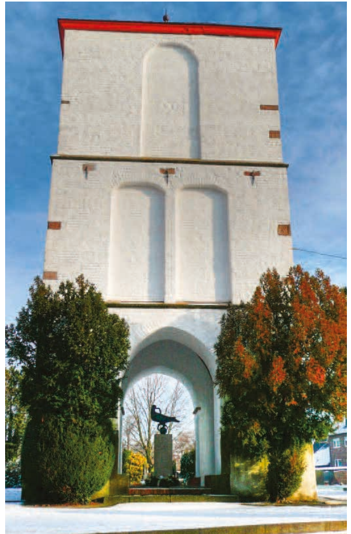
Turm der 1895 abgebrannten alten Pfarrkirche auf dem Friedhof Heute: Ehrenmal für Gefallene und Vermisste der beiden Weltkriege (1914-1918 und 1939-1945)