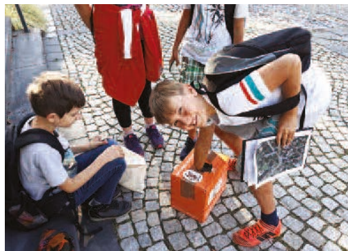
Und wer kann erfühlen, was sich in den Fühl-Kisten versteckt und speziell entsorgt werden muss? Genau, es sind Cd's, Batterien und Kork.