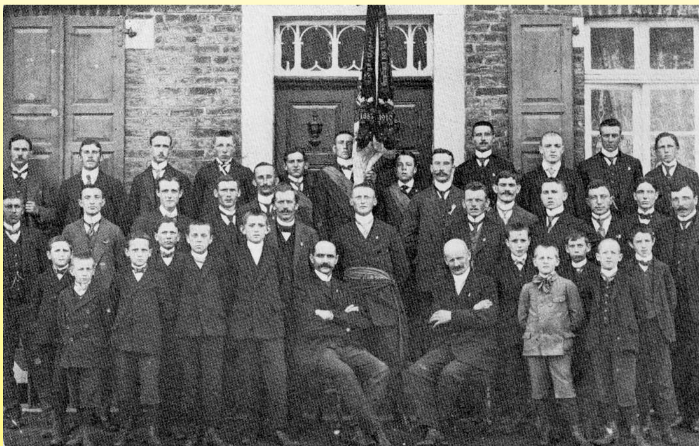
Der 1. Weltkrieg ergriff auch Merzenich - Mobilmachung am 1. August 1914

Zum Gedenken an das Waffenstillstandsabkommen zur Beendigung des 1. Weltkrieges am 11.11.2018