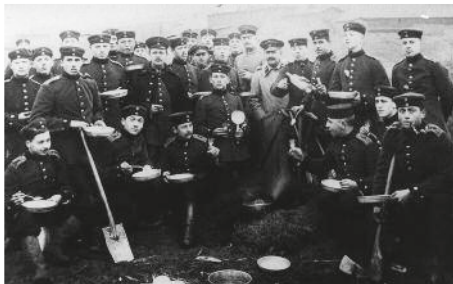
Soldatengruppe aus Merzenich in Frankreich im 1. Weltkrieg

Dabei ist es gerade einmal ein Jahrhundert her, dass sie lebten und viele von ihnen starben. Die Soldaten des 1. Weltkrieges. Der Waffenstillstand, der diesen 5jährigen Krieg beenden sollte, jährt sich in diesem Jahr am 11. November zum hundertsten Mal. Wer weiß das heute noch?