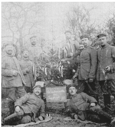
Auch im Krieg ging das Leben weiter - Merzenicher Soldaten zu Weihnachten in Frankreich 1914.

wird den zehn Millionen Todesopfern und etwa 20 Millionen Verwundeten auf beiden Kriegsseiten gedacht. Allein im Deutschen Reich leisteten 13,25 Millionen Männer den Militärdienst, davon starben 2 Millionen. Viele von ihnen kamen auch aus dem Rheinland und aus Merzenich. Lesen wir diese Zahlen, sind es für viele nur Zahlen. Die Leben, ihre Geschichte sehen wir nicht. Auch nicht das Ausmaß ihres Kriegsleidens- und sterbens. Ist das fragwürdig, verwerflich oder sogar skrupellos? Nein, es ist menschlich. Es ist wissenschaftlich bewiesen, dass wir Menschen bei schrecklichen Nachrichten und Ereignissen, die uns selbst nicht direkt persönlich betreffen, eine innere Distanz aufbauen.