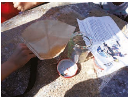
Beim Piraten-Experiment konnten die großen und kleinen Umwelt-Spezialisten ein Gefühl dafür bekommen, wie klein Plastik in den Gewässern werden kann. Leider gibt es noch keinen Filter, der die zum Teil mikroskopisch kleinen Partikel aus dem Wasser filtern kann.

14 Kinder aus der Gemeinde Merzenich können ihnen bei diesen Fragen als Umwelt-Spezialisten mit Sicherheit weiterhelfen. Sie nahmen im Rahmen des Ferienprogramms der offenen Kinder- und Jugendarbeit Merzenich an einer spannenden Umweltrallye des Sauberkeitsprojekts „Merzenich räumt auf“ teil. Projektleiterin Inga Mehler-Garms hatte für sie spannende