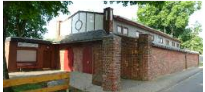
Die Goltzheimer Schützenhalle („De Zelt, die gute Stube Goltzheims“) im Jahre 2018

Joh, Ihr Minsche, ob aalt ode jong, von noh ode farn - De „Schötzehall“, die han mir all wahnsinnisch jern!