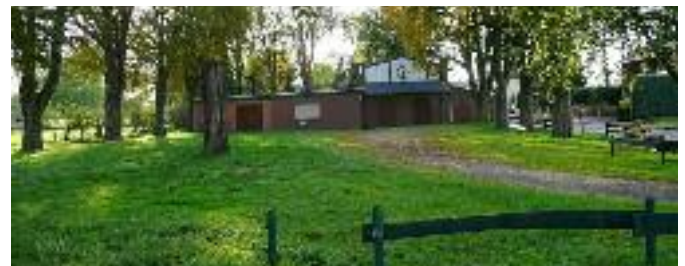
Schützenplatz mit altem Baumbestand