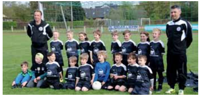
Vielen Dank den Firmen Glas Porschen und WWS Schutz und Sicherheit GmbH für das Sponsoring dieser tollen Ausrüstung.