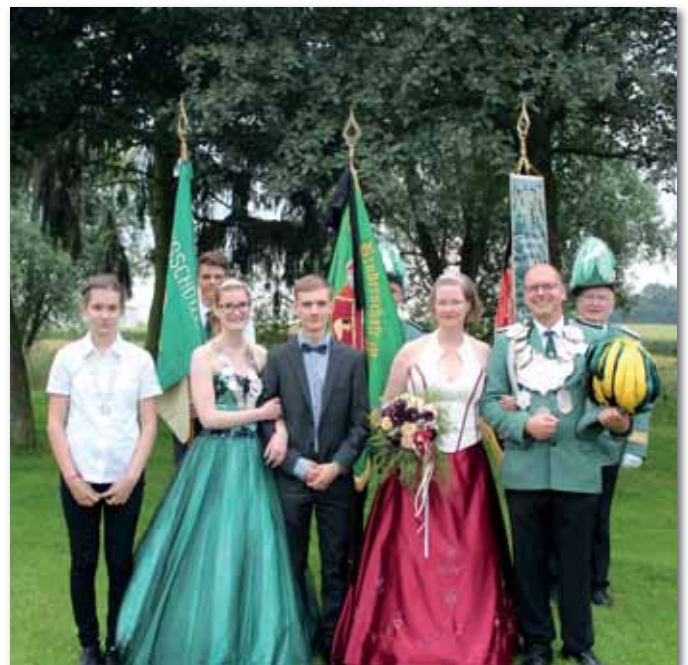
Die Majestäten des Jahres 2016/2017.