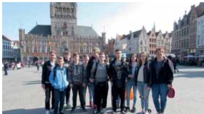
(Gruppe in Brügge)

Auch in diesem Jahr fuhr die Offene Jugendarbeit der Gemeinde Merzenich mit einer Gruppe von Jugendlichen im Alter von 14-17 Jahren zum Sunpark nach Ostduinkerke.