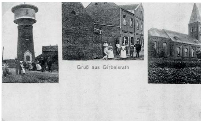
1930 Bild links der Wasserturm, mitte Gaststätte Schinchen, rechts die Kirche Nord-Ostseite.

Das Archiv Team sucht noch tatkräftige Unterstützung fürs Archiv.