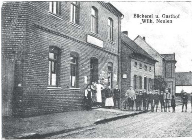
Grüß aus Girbelsrath