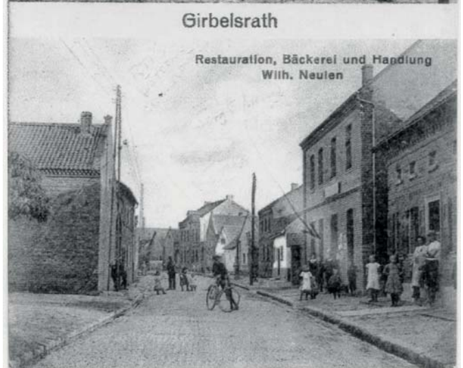
1920 Bild oben zeigt die Hauptstraße Richtung Osten, unten die Hauptstraße in Richtung Westen.