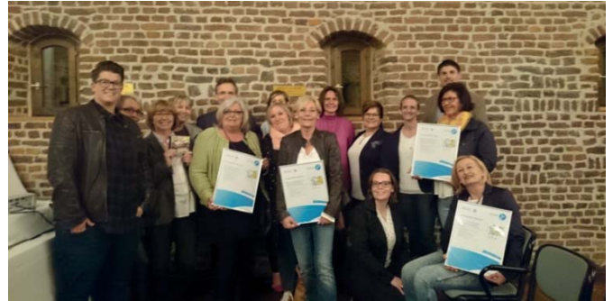
Hier bei der Zertifizierungsfeier auf Schloss Burgau.

Auf Schloss Burgau fand dann am Montag, 03.04.2017 im feierlichen Rahmen die Übergabe der Zertifikate statt. Zur Feierstunde kamen neben den teilnehmenden Kita's auch Vertreter der kooperierenden Vereine sowie Vertreter der Politik und des Landes- und Kreissportbundes.