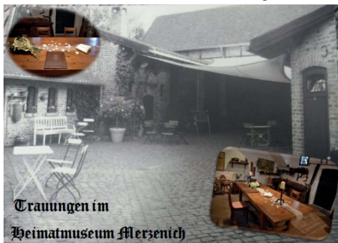
Trauungen im Heimatmuseum Merzenich

Sie möchten an einem außergewöhnlichen Ort heiraten? Dann sind Sie in Merzenich richtig!