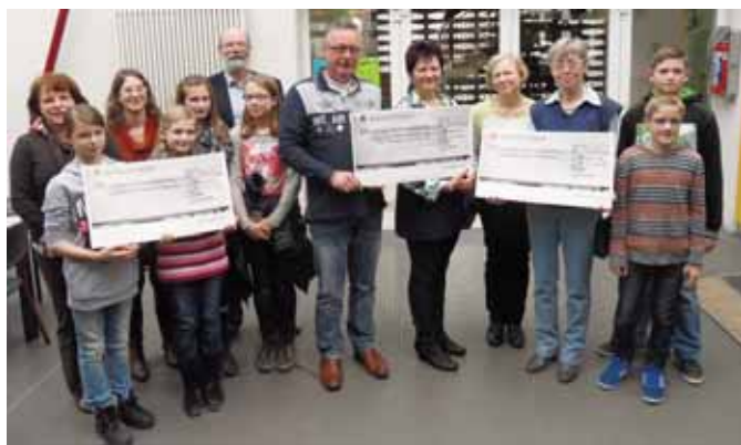
Drei sozialen Projekten kommen die Erlöse von über 15000,- Euro zu Gute