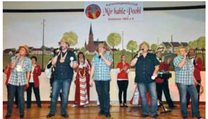
Die Gruppe „de Pöohl“ bei ihrem Auftritt