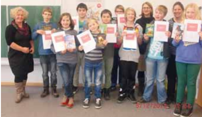
Alle Teilnehmer der Endrunde mit den Mitgliedern der Jury