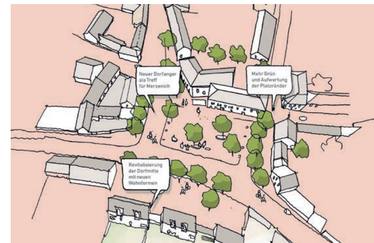
©: ISR Innovative Stadt- und Raumplanung GmbH